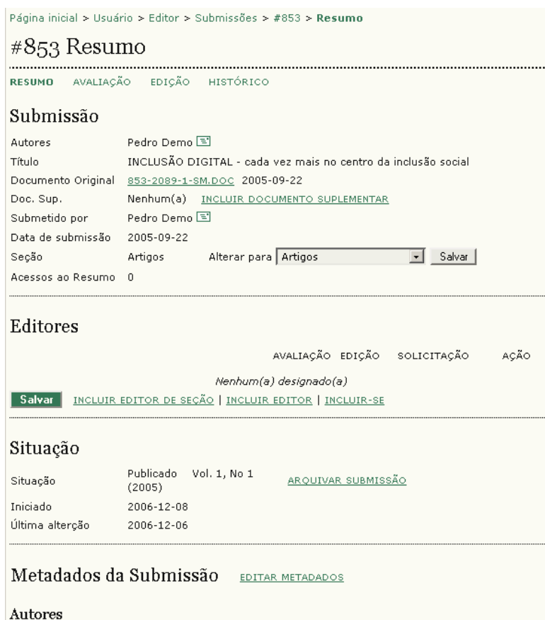
Figura 107: Página de resumo de artigo não designado

Na página ‘Resumo’, veja a seção ‘Submissão’: