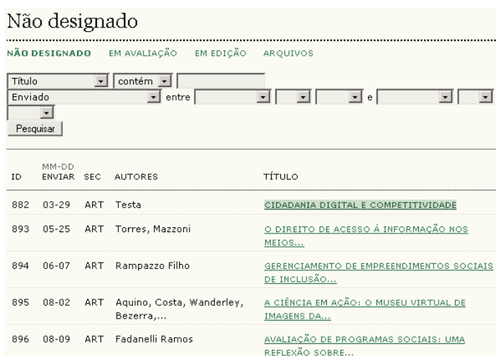
Figura 106: Selecionando um artigo não designado

Escolha 'Não designado' e clique no título, como link , de um artigo.