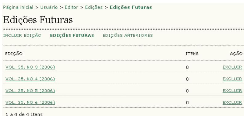
Figura 115: Edições Futuras

Ao escolher edições futuras, a lista de edições futuras é exibida: