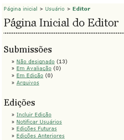
Figura 105: Menu do Editor

Em 'Submissões' estarão disponíveis as submissões 'Não designadas', 'Em avaliação', 'Em edição', ou no 'Arquivo'. Ao clicar em qualquer um desses links , serão exibidos detalhes de cada submissão para cada uma dessas categorias: