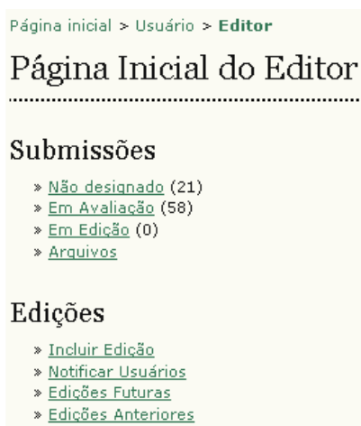
Figura 114: Menu da página inicial do Editor

Quando o processo editorial de uma submissão for concluído (avaliação e edição) e a submissão estiver pronta para publicação, o editor de seção encaminhará a submissão à edição apropriada. Na página inicial do Editor, escolha a 'Edição Futura' ou 'Passada' para visualizar artigos aguardando publicação: